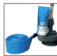
Tuyau de refoulement 10 m (livré sans raccord)