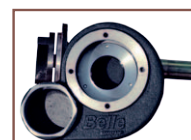
Turbine en acier moulé (pompe 7 m)

* Crépine livrée sans tuyau de refoulement, ni raccord.