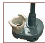
Raccord symétrique 3" pour crépine et tuyau