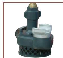
Crépine pour pompe de 7 m