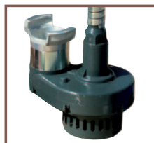
Crépine pour pompe de 5 m